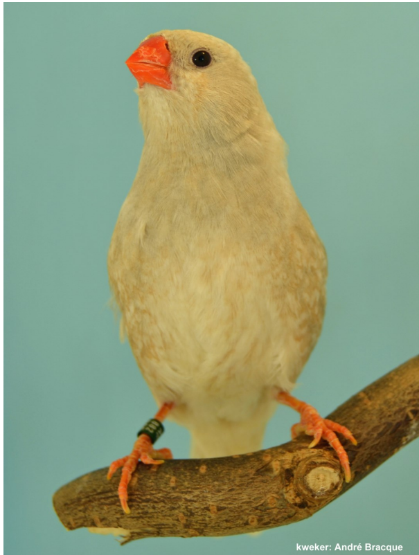
kweker: André Bracque